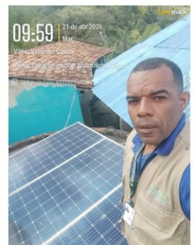
Figura 9. Inspección de paneles solares