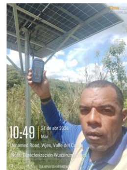
Figura 6. Medición Irradiancia