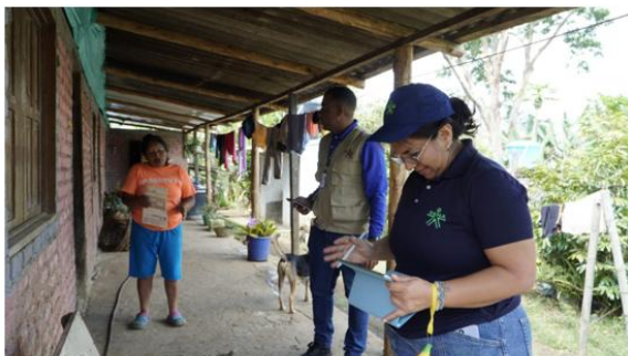
Figura 5. Realización encuesta socio energética