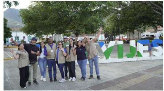
Figura 2. Equipo caracterización Vije