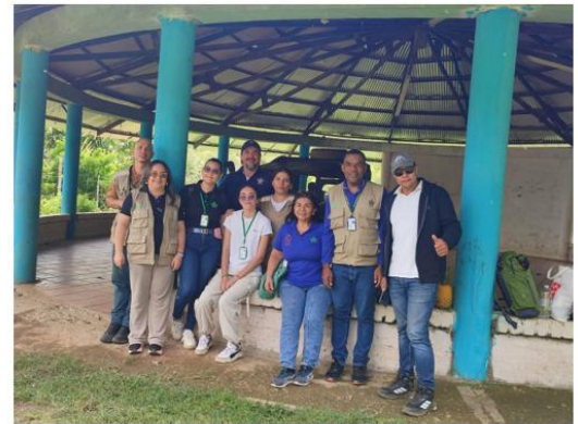
Figura 3. Equipo caracterización Vije, en la comunidad