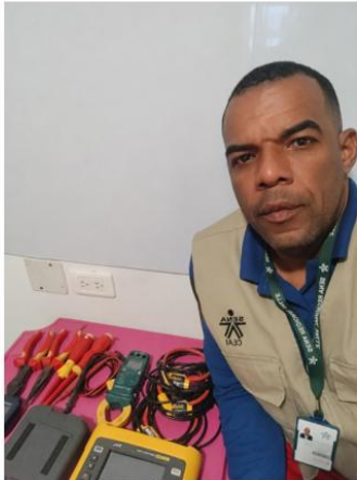
Figura 1. Almacenamiento de equipos

Registro fotográfico de las actividades realizadas: