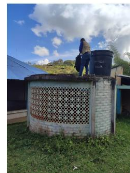
Figura 8. Inspección de paneles solares