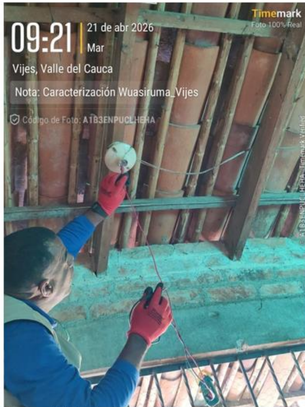
Figura 10. Medición de tensión en SSFV