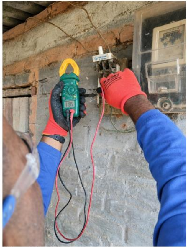
Figura 11. Medición de tensión