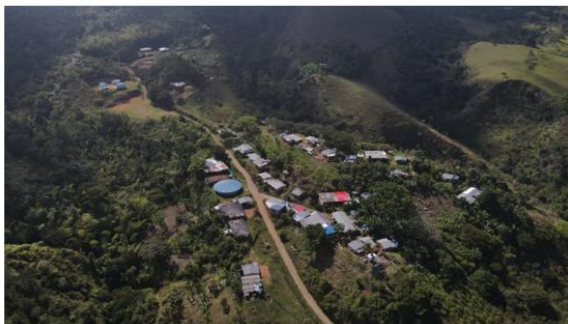
Figura 4. Comunidad de Wuzairuna